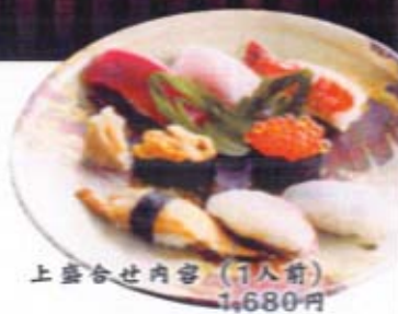
上盛合せ内容 (1人前) 1,680円