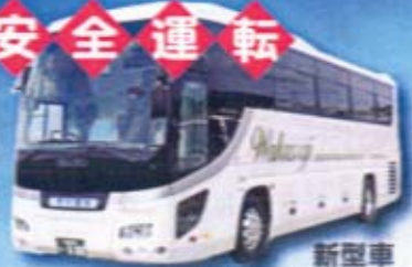
新型車 (座席:正45+補助8)