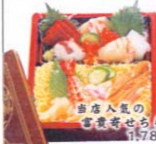
当店人気の 富貴寄せちらし 1,785円