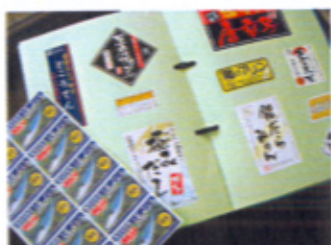
用途に合わせた様々なラベルシール

創業当初より現在に至るまで、エムアンドシィが主に取り扱うのは食品に関わる「ラベルシール」。スーパー等で販売される生鮮食品のラップに貼られるラベルから、お菓子、フルーツ、あらゆる食品のラベルなどを取扱います。水分に強いシール、また冷凍に適したシールなど、様々な用途に適したシール原紙を用いて、専門企業ならではの信頼性の高い製品を作っています。また、ビロー包装(写真下)の新規導入により、多種の商品とラベルシールと一緒に梱包できるようになりました。