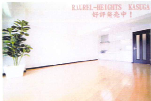
RAUREL-HEIGHTS KASUGA 好評発売中!

福岡市内・近郊でも築年数20~30年の物件が増えてきました。立て替えるのも難しい、借り手がなくて困っているという方が近年増加しています。現在の環境に合った間取りに変えるリノベーションを希望される方も多くなっています。取り壊して新築するにはコストがかかりすぎますよね。当社のリノベーションのノウハウを活かした提案を行っています。