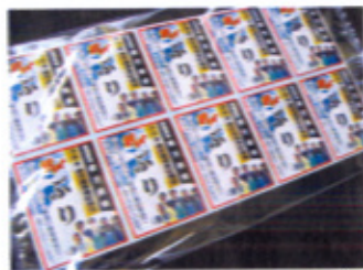
ビロー包装ラベルシール