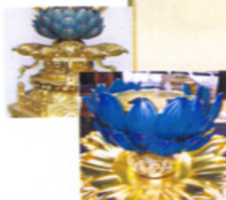
寺院等の修復・塗り替え等を施工しております