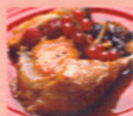
ハーブ鶏の 香草ペッパー焼き 830円