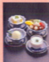
デザート各種 350円より