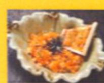
名物うにチャーハン 880円