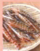
車エビの炙り焼き 330円 (1匹)