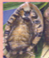
アワビと車海老で ご機嫌コース 2800円