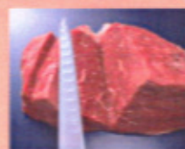
本日の特選和牛炙り なまら塩一振り 1230円