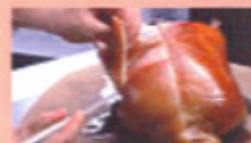
鶏肉の北京ダック風 クレープ包み 850円