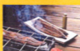
夏が旬アナゴ 蒲焼or白焼きで 680円より