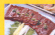
黒毛和牛レバ刺 880円より