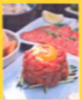
ミンクジラの バリ旨ユッケ 880円