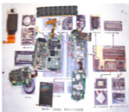
半導体や電子デバイスです。

東 南アジアや欧米諸国との取引が 主ですが、第一にマーケット規模 が違います。次に取引ロットの金額が 大きい。それに日本と違って売り手と 買い手の立場が対等で商談のスピード が速い。まさに即断即決という感じ ですね。