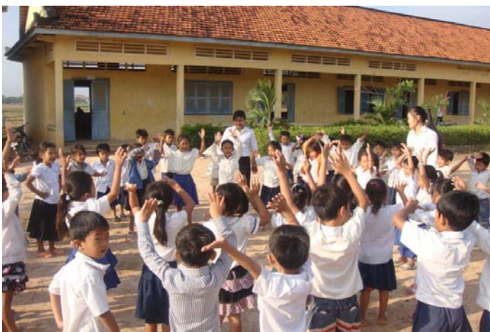
プレイベン小学校教員養成校学生の教育実習の様子 (カンボジア国プレイベン州にて)